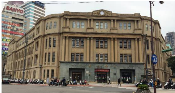
圖 2.2.1-2015 年臺北郵局