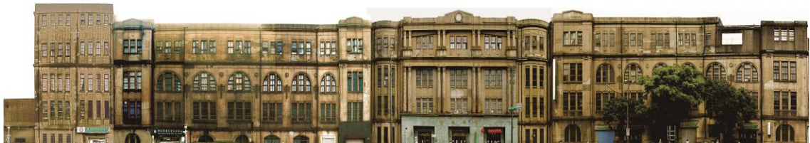
圖 2.1.3-2010 年臺北郵局全景

在臺北郵局興建過程中，曾發表過〈臺北郵便局敷地の地耐力と地下水〉 5 （臺北郵便局用地之地耐力和地下水）調查研究〈臺北郵便局の落成に當り其の過去を省みて〉 6 （臺北郵便局落成之際 省觀其過去）等報告。