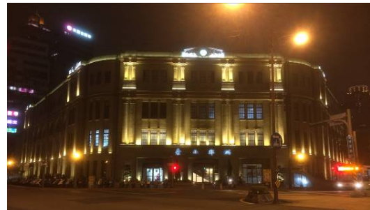
圖 2.2.2-2015 年臺北郵局(夜間)