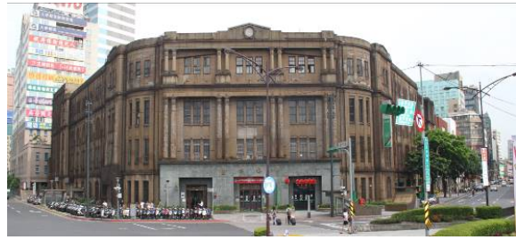
圖 2.1.2-2010 年臺北郵局