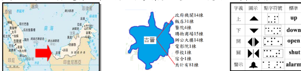
圖1、馬來西亞行政分區示意圖圖2、砂拉越古晉市位置圖 圖3、馬來西亞電梯點字詳圖『按鍵內部下方為點字』,為馬來西亞點字設置標準。3.施工層面:馬來西亞現行建築物電梯設備的點字系統設置是將點字位置和電梯按鍵(1)做一體之結合(2)外部貼片,因為馬來西亞政府未規定,施工人員並無點字相關知識,發生點字按鍵位置錯誤與按鍵顛倒之情形,故檢討點字貼內容、施作、位置等正確與否及比例。4.文化層面:古晉(馬來語:Kuching)是馬來西亞砂拉越的首府,是東馬乃至整個婆羅洲最大的城市。有華人的移民之特殊環境背景,將樓層之『四樓』視同『死樓』,故在電梯設備系統通常會順應民情而有所刪除或迴避,電梯樓層按鍵變更相對點字貼片字義有誤等因應方式加以分析探討。

(一)背景與動機:針對馬來西亞砂拉越古晉市地區(如圖1)無障礙電梯點字為對象,依點字的語言系統、字義、位置、按鍵配置與樓層等現況調查與彙整;即從設計、使用、施工及文化等四個層面作為無障礙電梯規範比較,說明如下:設計層面:(1)統一建築法(Uniform Building by Law)附則第34A條規定,活動場所及公共交通工具,應規劃便於殘疾人使用的設備或設施。針對電梯點字另在馬來西亞標準MS 1184和MS 1331 規範中僅有文字說明並無點字符號圖例,故將調查案例彙整後,以比例最高者為馬來西亞點字標準。(如圖3所示)2.使用層面:研究方式採取現地隨機抽樣調查及分析確認點字位置是否合理?馬來西亞針對視障人士所使用電梯點字規範僅有文字說明並無點字符號規定,故本文調查電梯點字貼片做初步彙整位置,以使用比例最高者