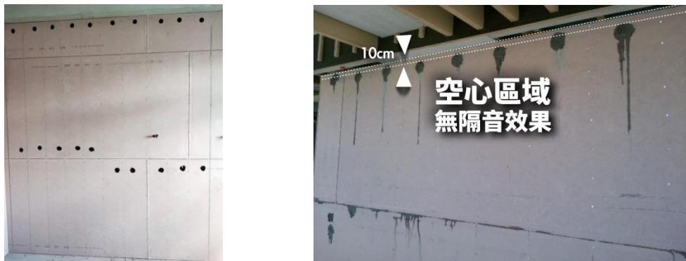
圖 4.5 濕式灌漿牆版面灌漿口開口位置