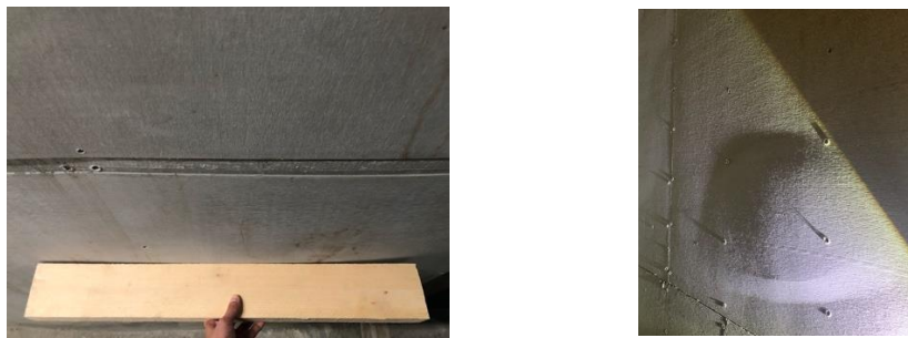
圖 4.4 泵送後板面隆起情況