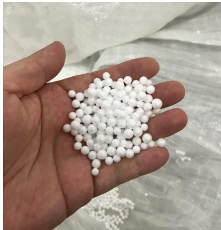
圖 4.1 輕質灌漿牆用保麗龍球

灌漿牆內使用的灌漿材料，最主要成分為水泥及細砂組成之水泥砂漿，但全都灌注水泥砂漿會使單位重過重，在輕質考量下會添加保麗龍顆粒，常用輕質灌漿材組成為水泥：細砂：保麗龍顆粒=1：2：4(體積比)，其中水泥、細砂為黏結材料，保麗龍顆粒則為填充降重與隔音為目的，其中水泥及細砂為天然材料，唯獨保麗龍為一人工材料，保麗龍是苯乙烯(styrene)為單體聚合而成的聚苯乙烯(polystyrene, PS)發泡製成(如圖 4.1)，它的高分子結構中充滿發泡劑，因為質輕又具保溫作用被廣泛使用。