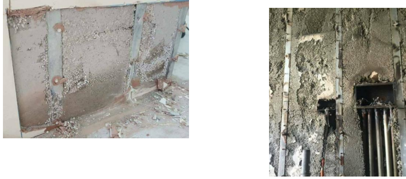
圖 4.3 輕質灌漿牆拆除後