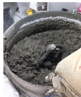
圖 4.2 輕質灌漿牆用保麗龍球