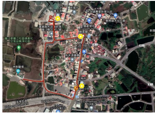
圖 4 謝鹽祭迎神路線圖(筆者繪製)

除了讓遊客預約參訪之外，「謝鹽祭」也是協會每年固定舉辦的活動，這項一年一度的活動起初是為展現傳統鹽業的祭祀文化，後來隨著協會在經營策上的調整，每一屆祭典的主題都不同，因此目前的謝鹽祭如同洲南鹽場一年來經營的成果發表會。其活動主軸大致分為迎神、表演、市集、親子闖關，因為內容迎神的關係，在整體活動上場域會切分為，迎神踩街動線的次空間、洲南鹽場內市集、與進行表演的主空間。