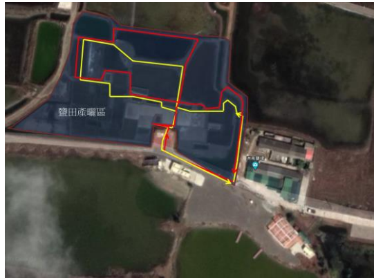
圖 2 鹽田導覽動線圖(筆者繪製)

然將鹵水從液態結晶成固態的關鍵階段，而且還需要大量的人力勞動，是最能展現自然環境與人文產業特色的區域。