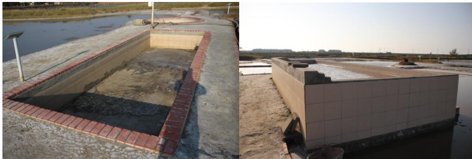
圖 9 鹵缸磁磚鋪面與高鹵缸

除了入口意象外，協會將曾經運鹽的五分車從廢鐵廠搶救回來，並重新設計成了車廂廁所，以再脈絡化的手法展現布袋鹽業運輸的景觀，讓這項作品不僅具有實用價值也傳達給訪客產業運輸的文化。而一旁半戶外的風光教室，則是因應活動需求而增加的設施，協會以風、陽光與人的互動為設計理念，空間僅用鋼構搭建而成，無遮蔽之壁體，讓遊客在此區休憩時，不僅可以一覽鹽田景觀，還能藉由自然的氣候減少對於能源的使用。