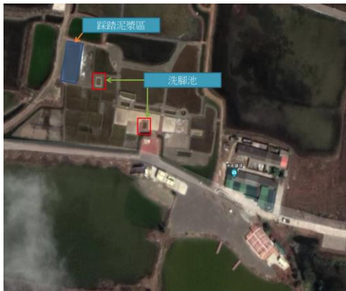
圖 3 產曬核心區洗腳池相對位置圖(筆者繪製)