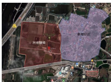
圖 1 聚落與鹽田位置關係圖(筆者繪製)

2007年基地規劃於嘉義縣布袋鎮新厝仔402號，主因在於此地離社區較近。若長期發展下來，不僅是復曬鹽田，洲南鹽場還是能讓社區居民一起進行休閒娛樂活動的公共場所，由此可看出來協會考慮到社區營造理念的用心[11]。