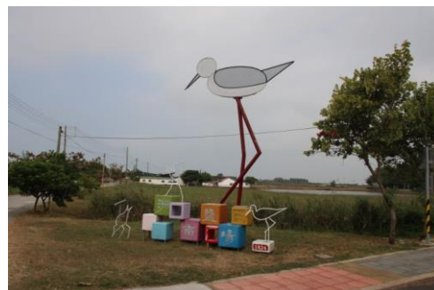
圖 7 洲南鹽場入口意象(筆者拍攝)