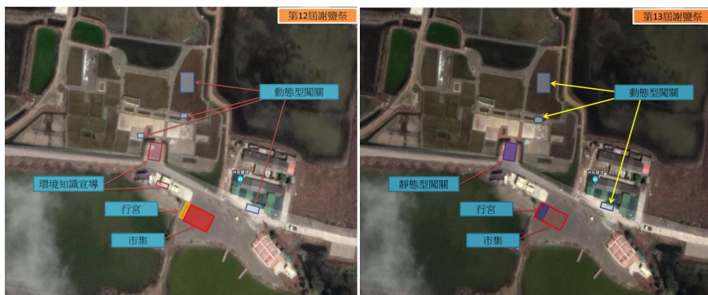
圖 5 第十二屆與第十三屆謝鹽祭洲南鹽場空間配置圖(筆者紀錄)

在迎神踩街的活動中，除了恭請地方神明前來酬謝祭祀以展現鹽村之民俗文化外，也藉由踩街向地方鄰近的住戶宣傳今天謝鹽祭的活動，遊街路線主要分佈在西側的龍江里，並不繞行整個村庄。從這點來看，藉由踩街活動來向地方村民宣傳的效力有限，僅屬附加價值，活動目標主要仍是讓到訪遊客親身參與地方常民的信仰文化。